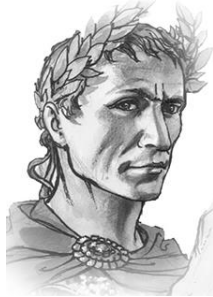
Domina te stesso Giulio Cesare