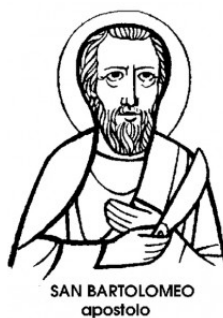
SAN BARTOLOMEO apostolo